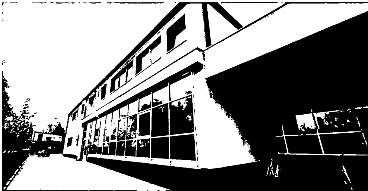
Zdjęcie nr 2b: Siedziba Przedszkola Samorządu Gminy w Czarnocinie

Zdjęcia nr 2: 2a, 2b: Budynki Zespołu Szkolno-Przedszkolnego w Czarnocinie