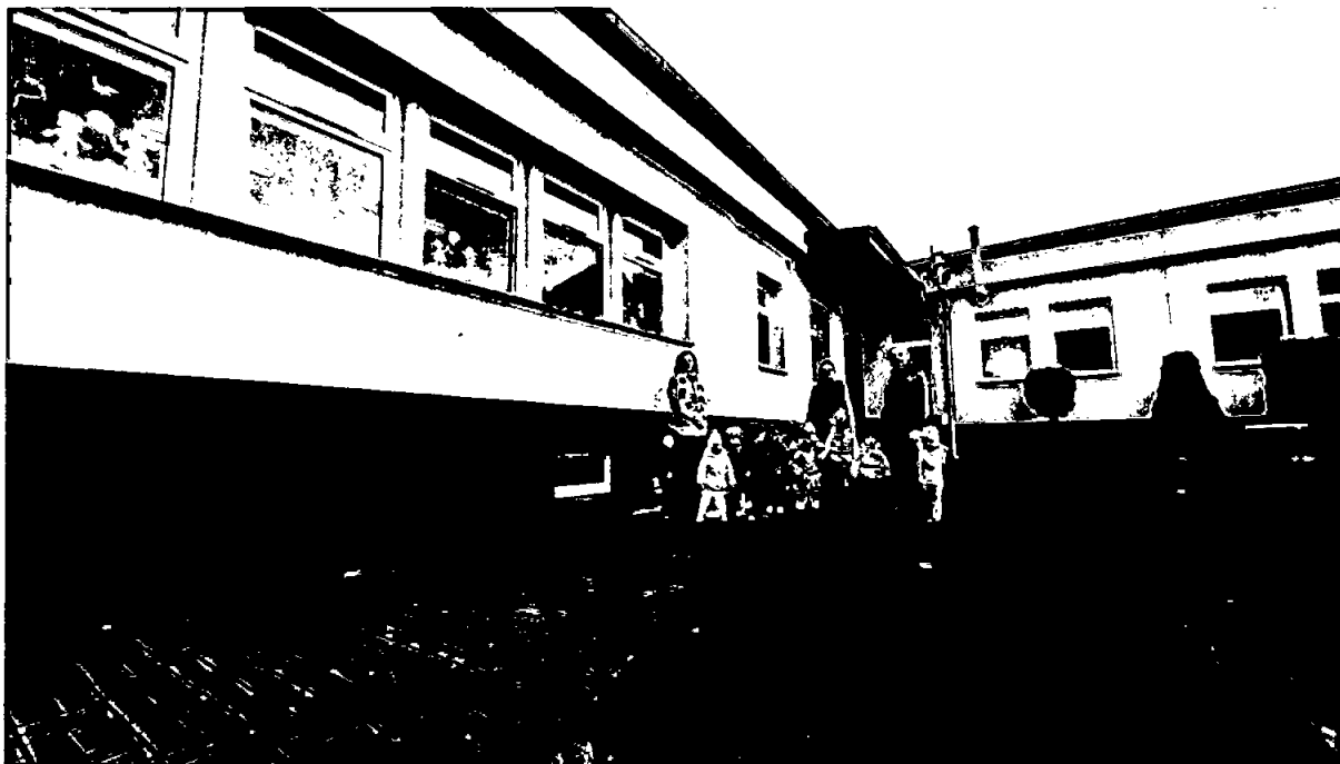
Zdjęcie nr 3. Siedziba Klubu Malucha w Czarnocinie

Uchwałą Nr XVIII/146/2020 z 15 kwietnia 2020 r. Rada Gminy Czarnocin przyjęła Statut Klubu Malucha w Czarnocinie, na podstawie którego 1 września 2020r. rozpoczął działalność samorządowy „Klub Malucha w Czarnocinie”.