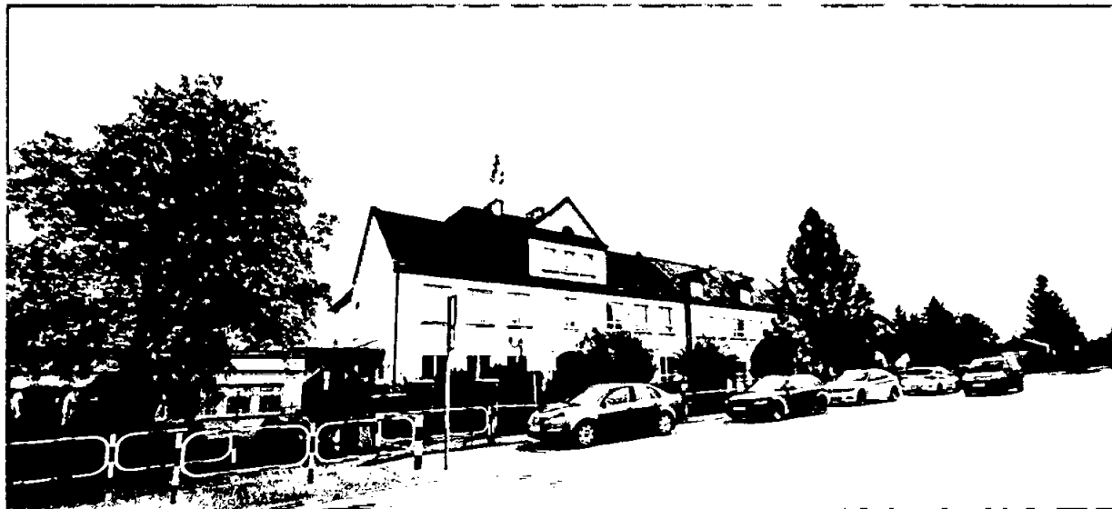
Zdjęcie nr 2a: Siedziba Szkoły Podstawowej w Czarnocinie